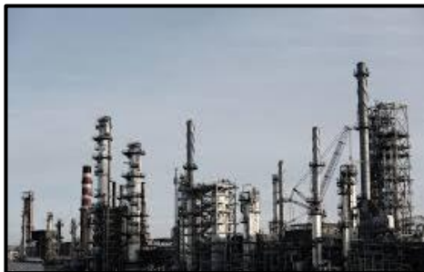
Perindustrian Berteknologi Tinggi