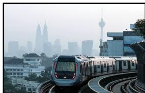
Sistem pengangkutan moden