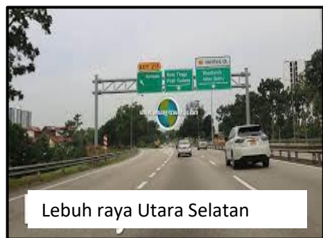
Lebuh raya Utara Selatan

Jelaskan pencapaian Dasar Pembangunan Nasional dan kesannya kepada rakyat Malaysia.